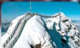
พิชิต 3 ยอดเขาดัง Rigi / Schilthorn / Glacier 3000