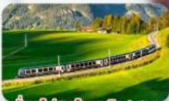
นั้งรถไฟสายโรเมนติก 2 สาย Golden Pass / Luzern Interlaken Express