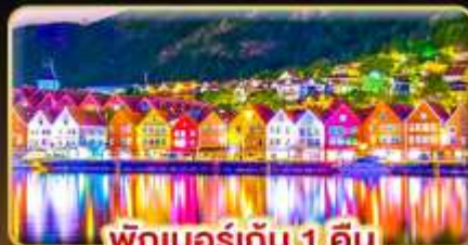
พักผ่อน 1 คืน