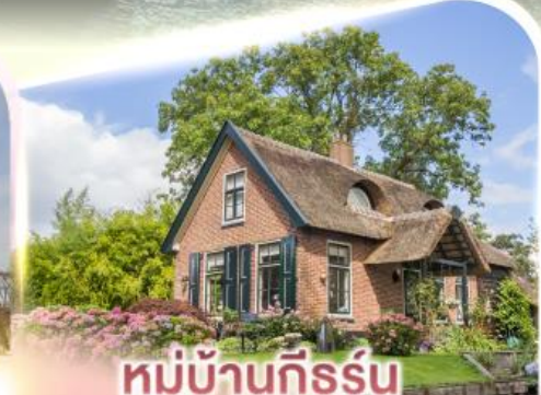
หมู่บ้านกิธูร์น