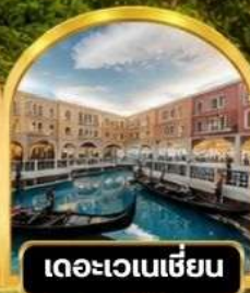
เดอะเวเนเชียน