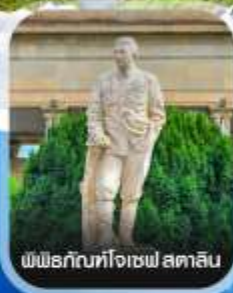
พิพิธภัณฑ์โจเซฟ สตาลิน