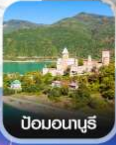
ป้อมอนาบูรี