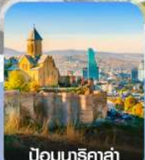
ป้อมนารีคาล่า