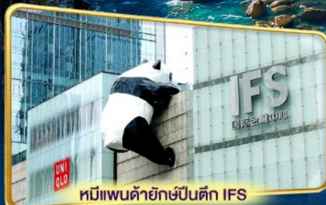
หมีแพนด้ายักษ์ปีนตึก IFS