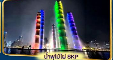
น้ำพุไม้ไฟ SKP