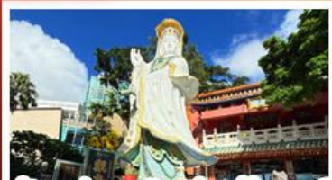
เจ้าแม่กวนอิมรัฟัสเบย์