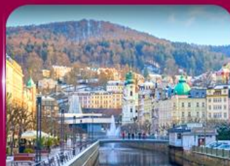
เมืองสปาแสนสวย คาร์โลว วารี