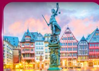
จัตุรัสโรมเมอร์ แพรงก์เฟิร์ต