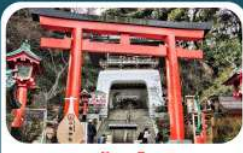
ศาลเจ้าอิเนะชิมะ