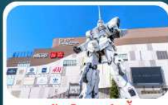
ห้างไดเวอร์ซิตี