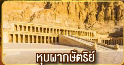
หุบผากษัตริย์