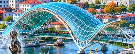
BRIDGE OF PEACE สะพานสันติภาพ