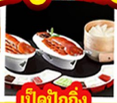
เปิดปีกัง