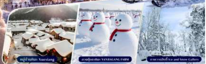
หมู่บ้านหิมะ Xuexiang