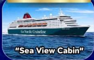
"Sea View Cabin"