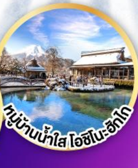
หมู่บ้านน้ำใส ไอชิโนะ-ซึกโก