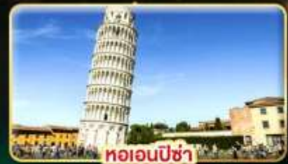
หออนพีซ่า