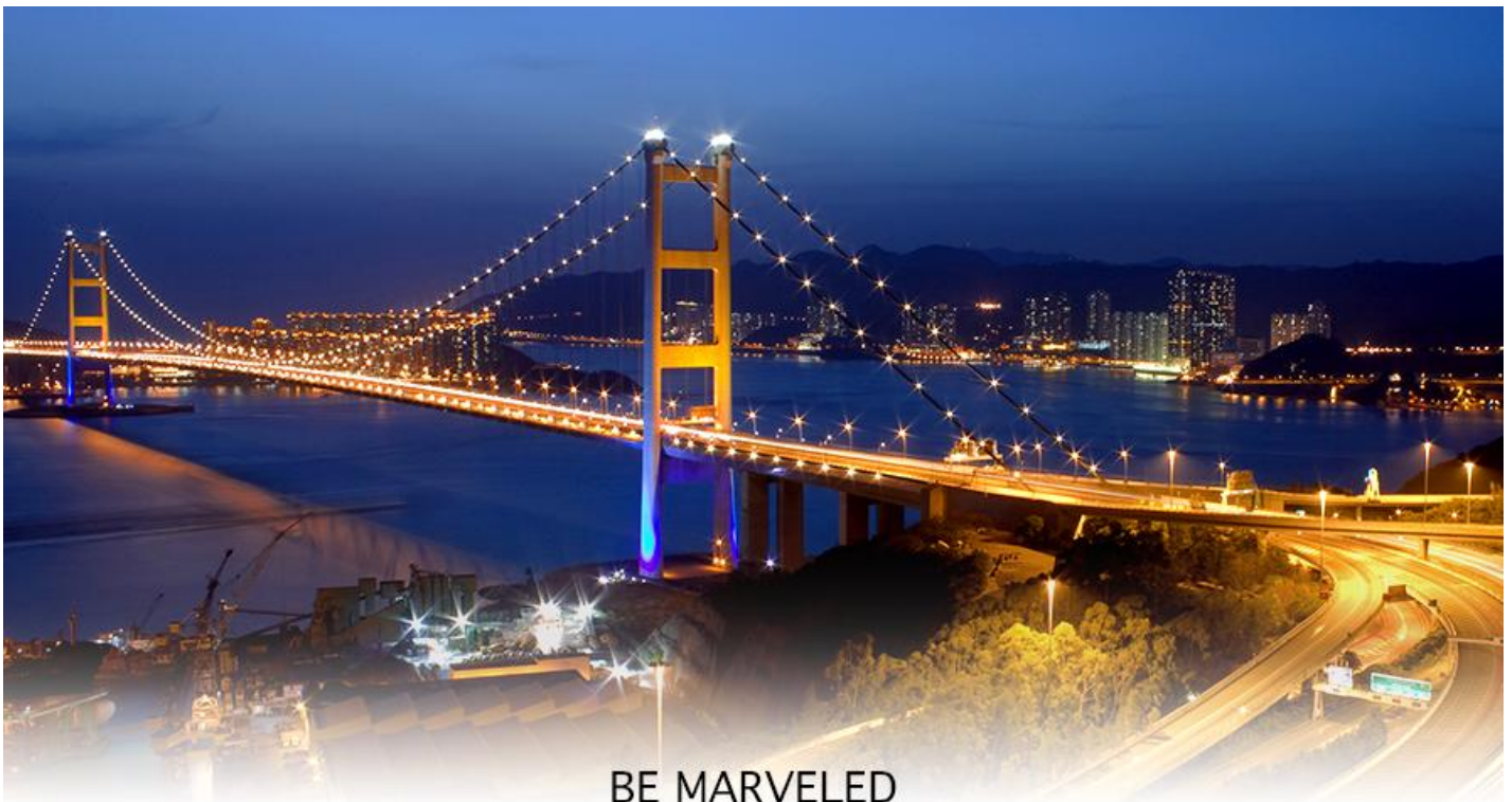
BE MARVELED สะพานแขวนชิงหม่า

17.40 น. เดินทางถึง สนามบินเซ็กแล็บก๊อก (CHEK LAP KOK INTERNATIONAL AIRPORT) เขตปกครองพิเศษฮ่องกง หลังผ่านพิธีการตรวจคนเข้าเมืองเป็นที่เรียบร้อยแล้ว รับกระเป๋าสัมภาระ เดินทางโดยรถโค้ชปรับอากาศ (เวลาที่ท้องถิ่นที่ฮ่องกง เร็วกว่าประเทศไทย 1 ชั่วโมง)