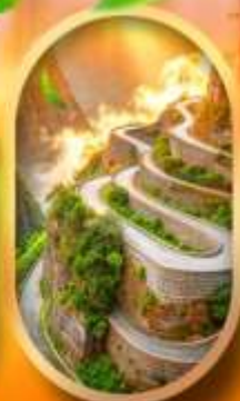
หุบเขาป้ายจ้าง