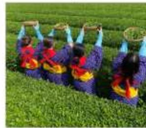
กิจกรรมเก็บชาみやโนเซ็น