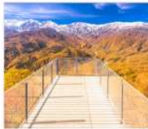
นั่งกระเช้าฮาคูมะ