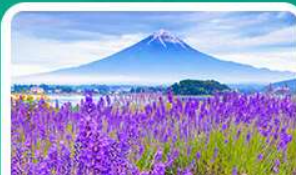
สวนโออิชิปาร์ก