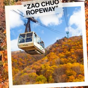
"ZAO CHUO ROPEWAY"

วันเดินทาง 30 ต.ค. - 5 พ.ย. 2569 4 - 10 พ.ย. 2569