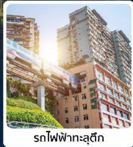
รถไฟฟ้าลุดีค

ไอโกลี! ตึกตะเกียบ แลนด์มาร์คขึ้นชื่อฉงชิ่ง ชมรถไฟฟหะลุดีค ช้อปยาวๆ ถนนคนเดินเจียฟางเป่ย อลัังการหงหยาดัง