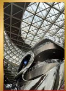
พิพิธภัณฑ์ศิลปะร่วมสมัยเซินเจิ้น

ชมสถาปัตยกรรมระดับโลก พิพิธภัณฑ์ศิลปะร่วมสมัยเซินเจิ้น (MOCAPE) และ Shenzhen Civic Center