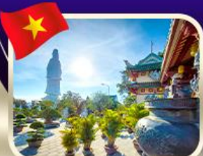
ขอพรกวณอิมวัดหลั่นอ๋อง