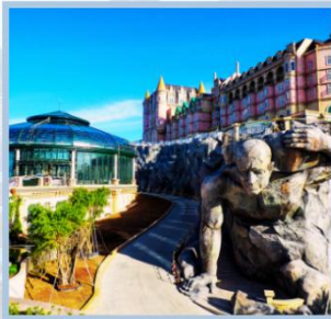
โซน Eclipse Square