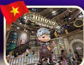
POPMART บานาฮิลล์