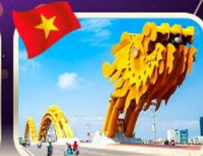
สะพานมังกร ดานัง