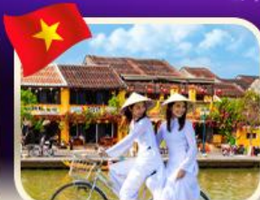
เชคอินเมืองเก่าฮอยอัน