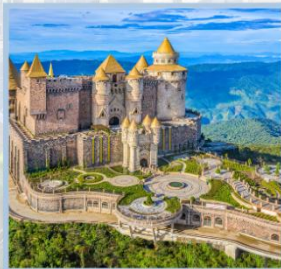
ปราสาทจันตรา