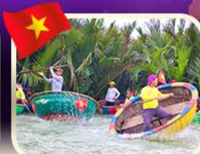
ล่องเรือกระด้งกิมทาน