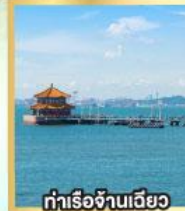
ท่าเรือจันทันเฉียว