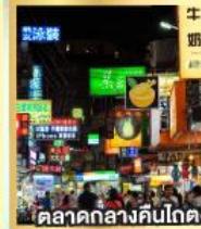
ตลาดกลางคืนโตง