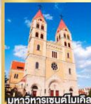
มหาวิหารเซนต์ไมเคิล