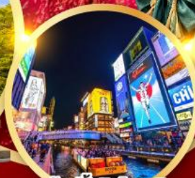
ช้อปปิ้งชินโซบาช