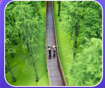
“ป่าสนชิงซาน”