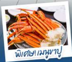
พิเศษ! เมฆหุซุ