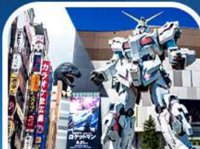
ช้อปปิ้งชินจูกุ+กันดั้มยักษ์