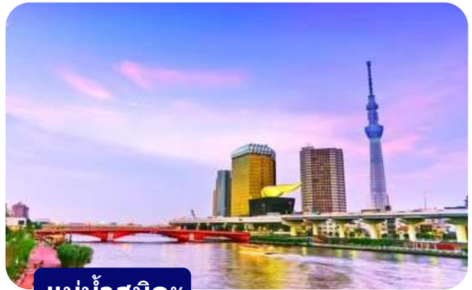
แม่น้ำสุมิดะ

ส่วนไฮไลต์สำคัญของวัดนี้คือ ไตคอน หรือหัวไข่เท้า สัญลักษณ์ศักดิ์สิทธิ์ คนที่นี้เชื่อว่าไตคอนช่วย "ชำระล้างสิ่งไม่ดี" และนำโชคลาภเข้ามา นักท่องเที่ยวมักนำไตคอนไปถวายเพื่อขอพร