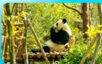
ศูนย์หมีแพนด้า