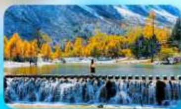
ปี้ผิงโกว