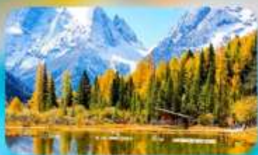
กูเวาสี้ครุณี