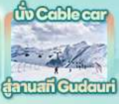
นั่ง Cable car สู่ลานสกี Gudauri