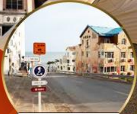
ถนนอ่าวจีป่า