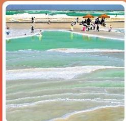
ทะเลสาบเกลือจาเอ๋อหนาน