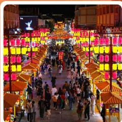
ตลาดกลางคีนซาโจว