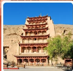
ถ้ำมั่วเกาตุ

ไฮไลท์! ถ้ำมั่วเกาตุ ถ้ำพุทธศิลป์โบราณ มรดกโลก UNESCO ภูเขาสายรุ้งจางเย่ ภูเขาหินสีสันแปลกตา หนึ่งในภูมิประเทศที่แปลกที่สุดในโลก