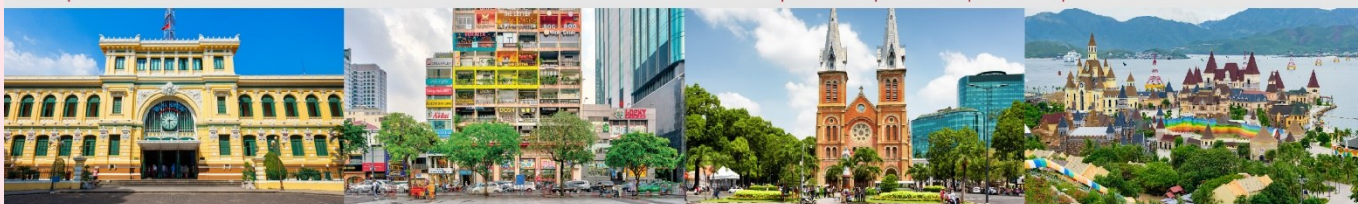
ไพรบ์ย์กกลางโฮจิมินห์