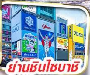
ย่านชินโซบาชิ