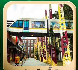
“ตงเจียวจื่อ”