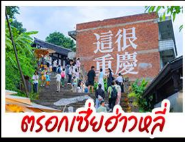
ตรอกเซี่ยฮ่าวหลี่