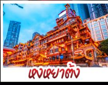
ตงเฉยฮาดัง