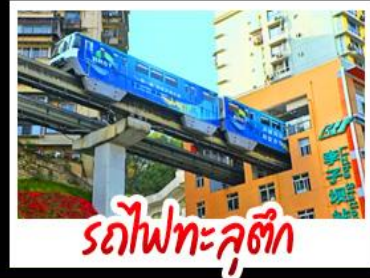
รถไฟทะลุติ๊ก