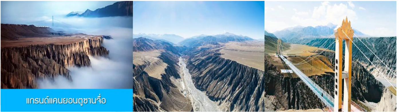
แกรนด์แคนยอนตูซันจื่อ