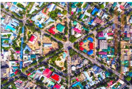
ถนนหกแฉก

จากนั้นนำท่านเดินทางสู่ เมืองอิหนิง 伊宁 (ระยะทาง 200 กม. ใช้เวลาเดินทางราว 3 ชั่วโมง)