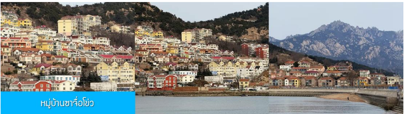
หมู่บ้านซาจื่อโขว่

เที่ยง รับประทานอาหารกลางวัน ณ ภัตตาคาร (มื้อที่ 7)