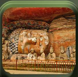
“ พาหินแเกาะสลักต้าจู้ ”

T2G-CKG26CZ Special of Chongqing...จงซิ่ง ต้าจู้ อุ้หลง อุทยานหลุมฟ้า เขานางฟ้า 5D 3N (CZ)