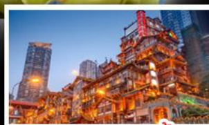
ตลาดแดงเขานาง