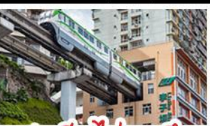
สถานีรถไฟทะเลสาบ

ดงซิ่ง - อุโมงค์ - หงหยาดัง - อุทยานเขานางฟ้าดงซิ่ง สถานีรถไฟทะเลสาบ - หลุมฟ้าสามสะพานสวรรค์