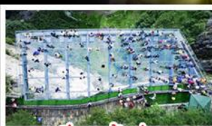
ระเบียงงักว๋ออยู่หลง