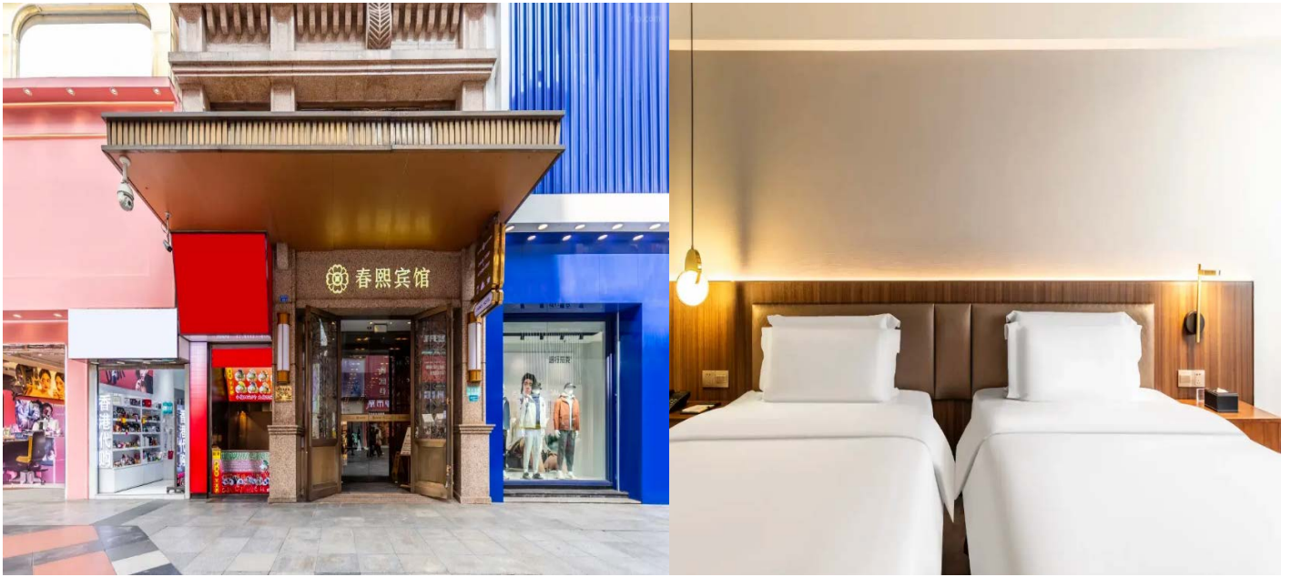
โรงแรมใจกลางย่านช้อปปิ้งชุนซีลู่

Cheangdu Chunxi Hotel ย่านช้อปปิ้งชุนซีลู่ หรือระดับเทียบเท่า พักห้องละ 2-3 ท่าน หมายเหตุ โรงแรมที่พัก จะแจ้งให้ท่านทราบ ก่อนเดินทางโดยประมาณ 5-7 วันทำการ