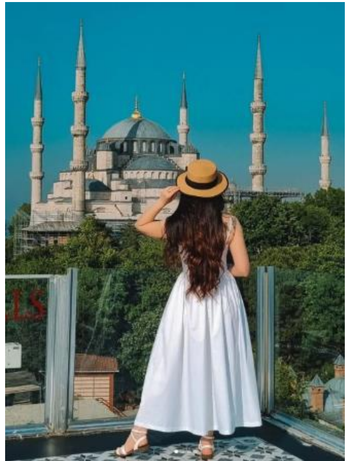
สมควรแก่เวลา นำท่านเดินทางสู่สนามบินอิสตันบูล