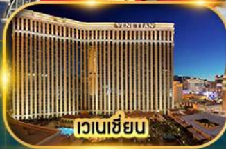
เวเนเซียน