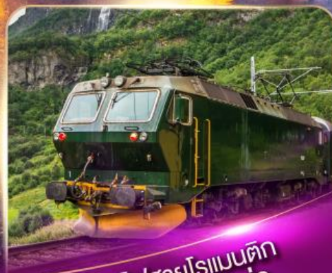
รถไฟสายโรแมนติก ฟลิมส์บาน่า