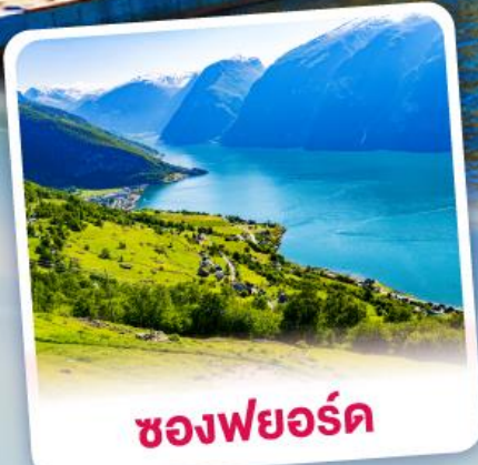
ช่องฟยอร์ด