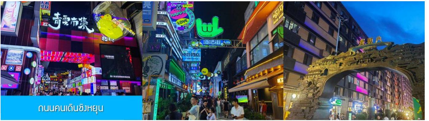
ถนนคนเดินชิงหยุน

เย็น บริการอาหารเย็น ณ ภัตตาคาร(มื้อที่ 9) หลังอาหารนำท่านเที่ยว ถนนคนเดินชิงหยุน 青云市集 เป็นย่านการค้าโบราณที่ถูกพัฒนาเป็นแหล่งรวมร้านค้าและสตรีทฟู้ดที่คึกคักใจกลางเมืองกุ้ยหยาง ให้ท่านเพลิดเพลินกับการเดินชมหรือเลือกซื้อสินค้าพื้นเมืองในย่านการค้าที่คึกคักแห่งนี้ พักที่ HOLIDAY INN HOTEL ระดับ 4 ดาวท้องถิ่นหรือเทียบเท่าในเมืองกุ้ยหยาง