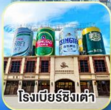
โรงเบียร์ซิงเต่า