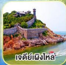
เจดีย์เฝิงไหล